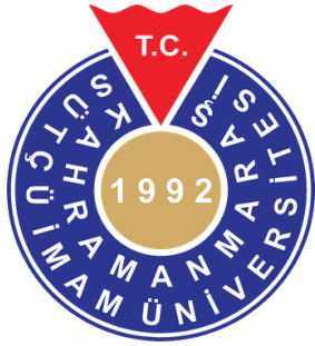
Kahramanmaraş Sütçü İmam University, Türkiye